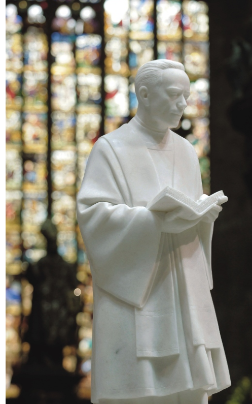
Estátua do bem-aventurado em Duomo - Catedral de Milão

Em 1994 foi fundada a Associação “A Nossa Família” , entidade sem fins lucrativos, com o objetivo de desenvolver a promoção humana, contribuindo com o desenvolvimento social de cada pessoa. Após um ano de avaliação foi decidido de fazer um trabalho de prevenção sobre a saúde das crianças. Os primeiros atendimentos iniciam-se em dois compartimentos da casa dos voluntários. Após alguns meses foi ativada